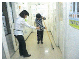
近隣事業所での清掃練習