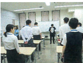
訓練生中心の朝礼