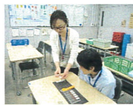
軽作業で作業の幅を広げます。