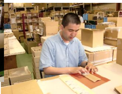
袋にシールを貼っています