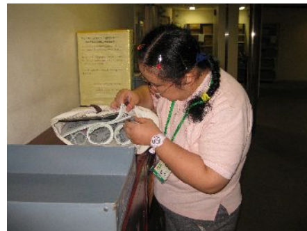
頑張っているお二人です

仕事内容は、区役所内の各部署への新聞配布や交換便配達、区役所で配布するパンフレットにシールを貼る作業などを行なっています。