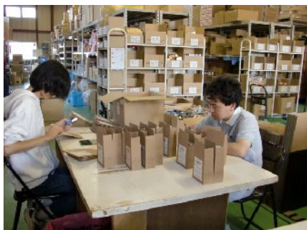
熱心にお中元商品を作りました

今後も多くの企業で体験実習させていただく機会をつくり、それぞれの訓練生に適した職場を見出し、就職意識を高めるきっかけとしていきたいと考えています。ぜひ、企業の皆さまのご協力をお願いいたします。