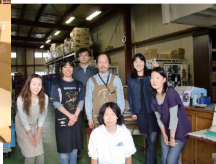
会社みなさんと一緒に