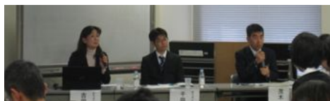
知的障害の方向けのセミナーの様子

知的障害の方向けには53名、精神障害の方向けには66名が参加しました。参加者の皆さんは、熱心にメモを取りながら、講演に耳を傾けていました。