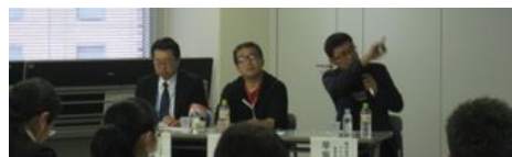
精神障害者の方向けのセミナーの様子