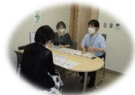
めんだん ようす 面談の様子

とくていそうだんしえん 特定相談支援 じぎょうじよ 事業所による けいかくそうだん 計画相談